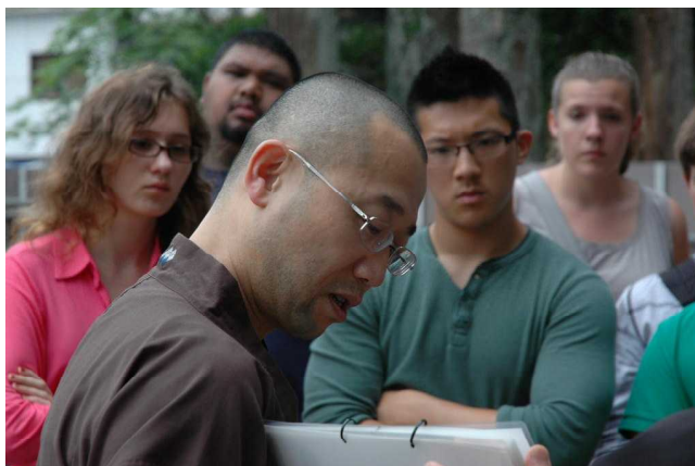
学生の真剣な眼差しに、職員の説明も熱を帯びます

今回、特別に実施された作業中の中門再建現場の見学では、開創法会事務局の職員から、819年に初めて建立され7期中門が焼失後、約170年ぶりの再建にいたる信仰上の意義や考古学、建築学的な背景などの説明を受けました。また、各自が思い思いに、伝統的なヤリガンナで削られた独特の加工跡の残るヒノキ材の表面の感触を手で確かめたり、ほのかな樹の香りを楽しんだりしました。