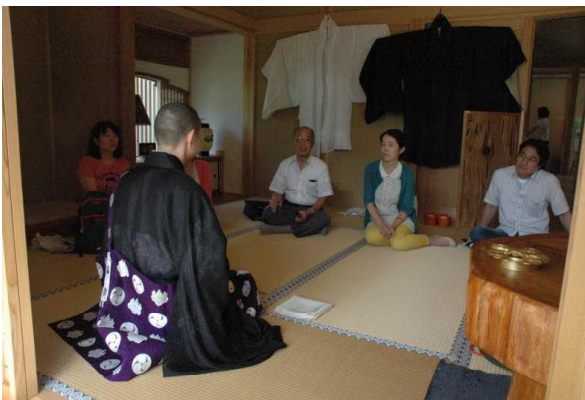
密教法具の実演。素朴な疑問がなげかけられます