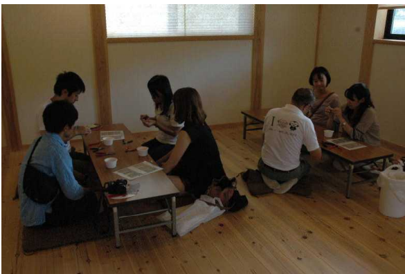
高野霊木の感触。1200年の自然を体感

まだ夏の日差しが残る9月15、16、17日の3日間、金剛峯寺本坊、伽藍中門作業館、高野霊木之家を中心に壇上伽藍、大師協会など金剛峯寺周辺の各所を会場として高野山、金剛峯寺、開創大法会をPRするイベント、「六波羅蜜～高野山で密教三昧～」が開催されました。イベント前半は初秋の清々しい天候にめぐまれ、メイン会場となった伽藍中門作業館、高野霊木之家には3日間で約2400人もの来場者があり、盛況のうちに終了しました。