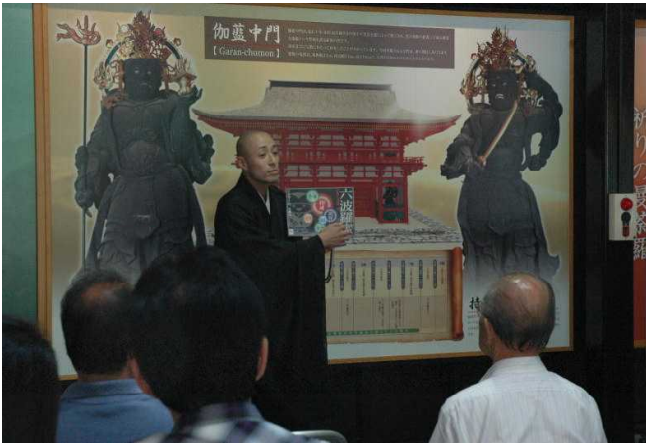
密教について熱く解説する青年僧