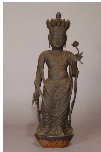
重文 十一面観音立像（宝亀院）

料 金 大人600円 高校・大学生350円 小・中学生250円 高野町住民は無料で入館頂けます。 (免許証・保険証等証明するものをご提示下さい)