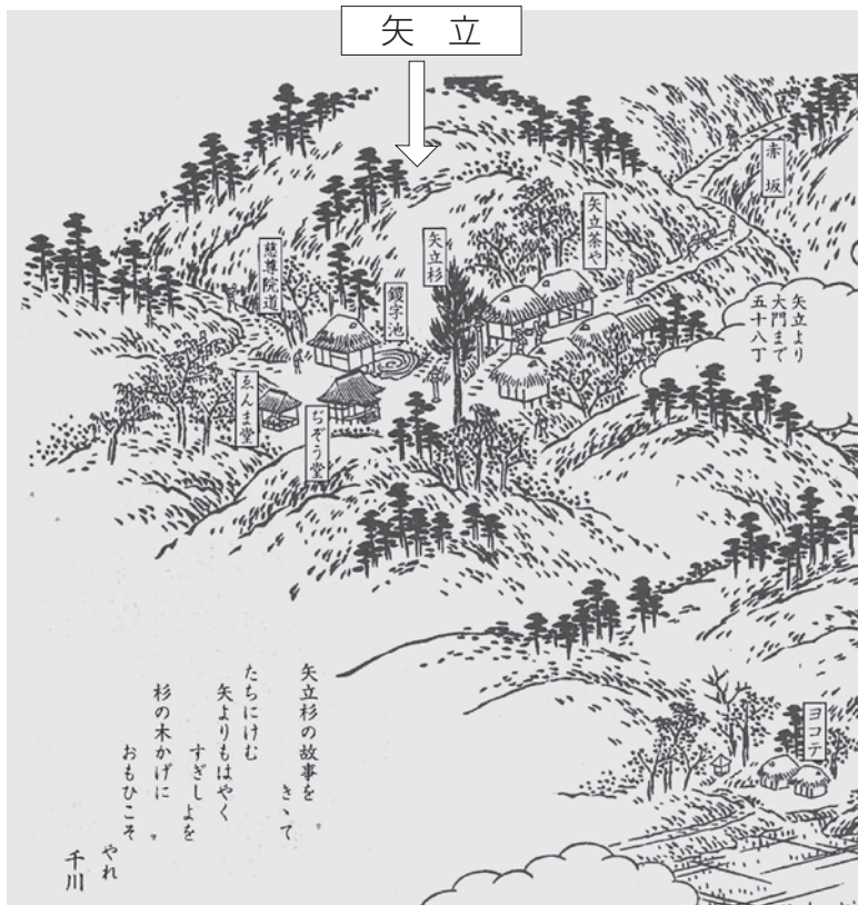
『紀伊国名所図会』より