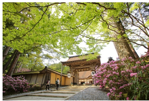
金剛峯寺 新緑