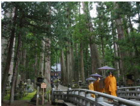
奥之院 しょうじんく 生身供

高速バス「京都高野山線」は直通 約2時間30分 で京都と高野山を結びます。乗り換えが必要な鉄道移動に比べ、お客様の利便性は格段に向上します。