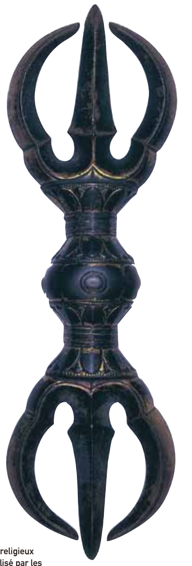
Sankosho C'est un outil religieux du Mikkyo utilisé par les bonzes lors de la pratique religieuse

On peut louer des audioguides qui offrent un soutien linguistique en japonais, anglais, français, chinois et coréen, à l'association Shukubo.