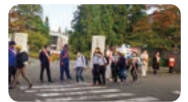
見守り活動の様子