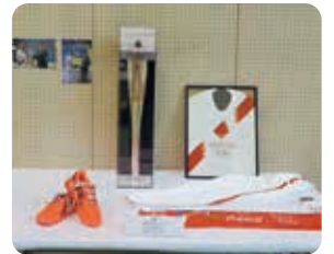
図 高野町教育委員会 ☎ 0736-56-3050