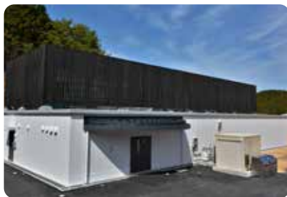
完成した新しい高野町学校給食センター