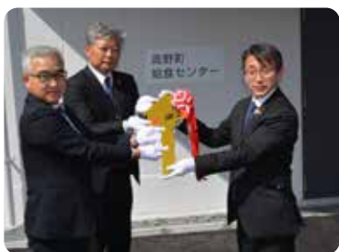
新給食センター前での引き渡し式

高野町学びの交流拠点整備事業の先行工事として「高野町学校給食センター」が完成し、4月6日(火)に引き渡し式が行われました。また、4月15日(金)には、住民の皆さまを対象とした特別内覧会を開催し、21名の方に内覧していただきました。