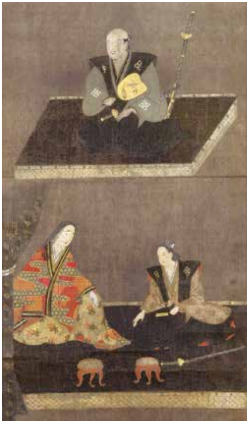
武田勝頼妻子像 持明院蔵 桃山時代 現状では武田信虎・晴信（信玄）像と共に1つの箱に納められています。

前号でも紹介しましたが、勝頼の供養塔は奥之院に、信玄供養塔と共に建っています。いずれの石塔も江戸時代中期の特徴を示しているのです。生き残った元家臣やゆかりのある人物が建立した、もしくは生前に建立したのち破損し、再建した可能性もあります。次号では信玄と言え、あの武将を紹介する予定です。