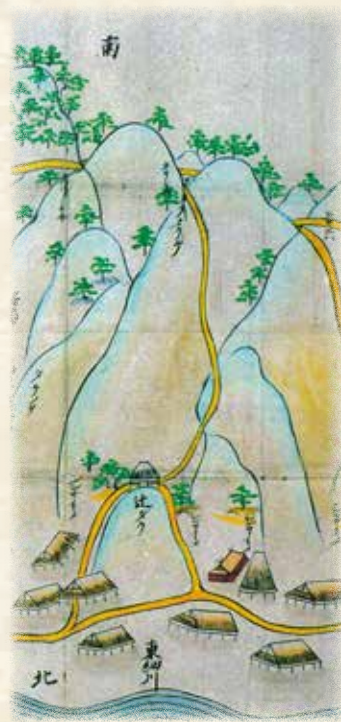
▲「東細川絵図」元和6年 細川区有文書(「高野町の昔と今」より)

細川八坂神社の東側の道を山向きに登っていきますと、地蔵堂があります。石像の地蔵尊が祀られています。この地蔵尊は安産の地蔵として親しまれています。お供えしたろうそくの長さによって、安産のご利益を占なうといった言い伝えも残っています。