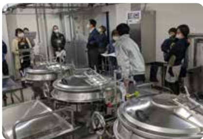
特別内覧会の様子