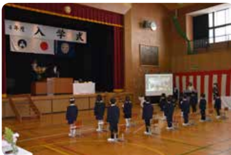
高野小学校 富貴分校