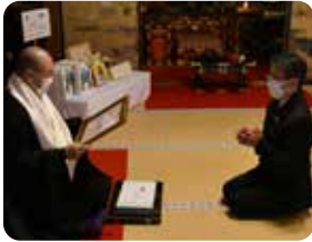
図 観光振興課 産業・振興係 ☎ 0736-56-2780

昨年7月に体験会で収穫した富貴産ホップと、クラフトビール「天空般若」を3月29日(火)に、総本山金剛峯寺に奉納しました。高野町の資源を活用し、土づくりにこだわって栽培したホップはより一層元気に育ち、「天空般若」は一段と美味しくなりました。これらホップと「天空般若」のご報告に併せて、本年もホップをはじめとした農作物の豊作と農作業の安全を祈願しました。高野町クラフト般若協議会は今後も高野町の農産物が広く活躍できるように取り組んでまいります。