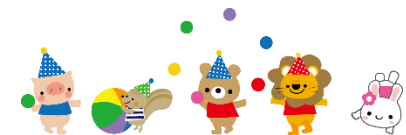
〈令和5年度 らっこくらぶの様子〉