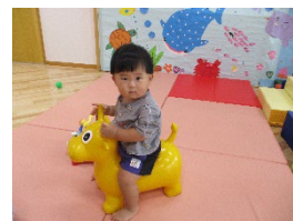
じょうずにのれたよ。