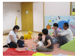
みんなでわいわい楽しく遊びました。