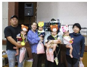
こども園の運動会に参加しました。